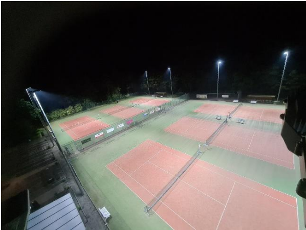
Dark Licht bij SV Austerlitz

Het gehele proces van aanvraag tot installatie en onderhoud nemen we uit handen. Als er een aanvraag binnenkomt brengen wij een vrijblijvende offerte uit en komen we eventueel langs voor een technische schouw. Daarnaast kunnen we een lichtplan maken, eventueel met lichthinder-berekening, om een visueel beeld te schetsen van de situatie op uw sportpark. Ook voor het plaatsen van masten en aanleggen van grondkabels zijn wij de juiste partij. Samen zorgen we ervoor dat de sporters op zo snel mogelijk kunnen spelen onder duurzame en verblindingsvrije ledverlichting van Dark Licht!