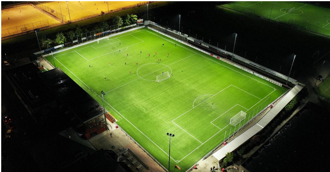
500 lux installatie met Dark Licht bij VV Katwijk