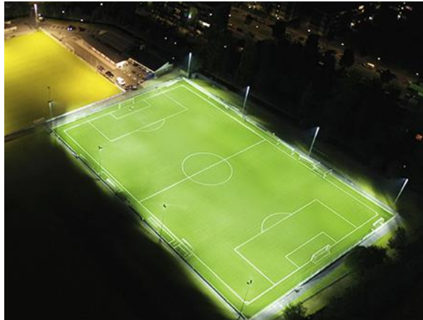
Dark Licht bij VV BMT