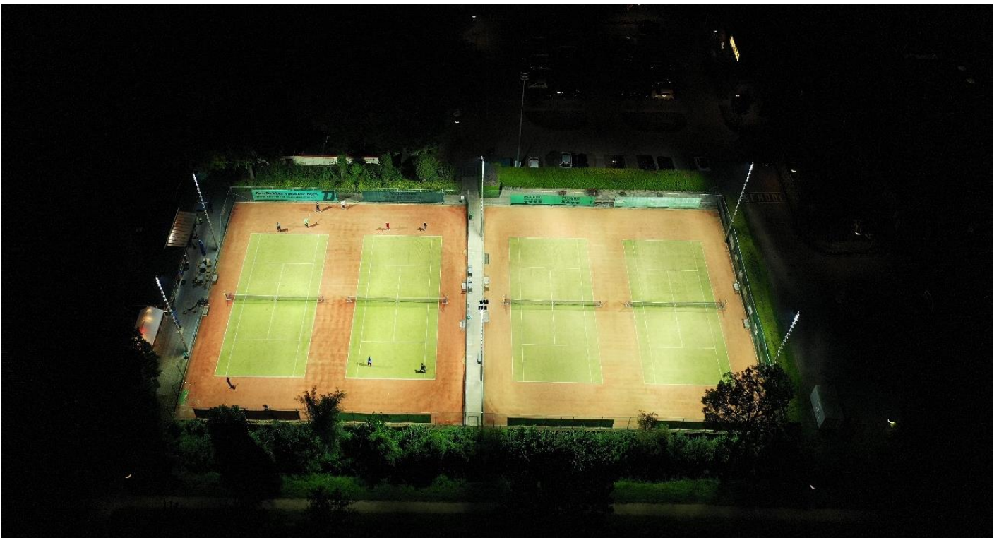
Dark Licht bij LTV Almkerk